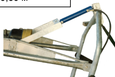
гидравлический механизм регулировки